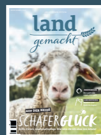
AUSGABE 6 2023