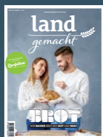
AUSGABE 4 2022