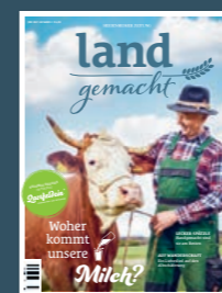
AUSGABE 2 2021