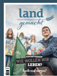
AUSGABE 5 2022