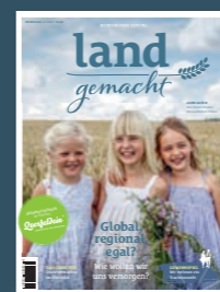
AUSGABE 1 2020

Macher, Schaffer, Erzeuger, die Tag für Tag mit Herzblut ihrer Arbeit nachgehen, mit eigener Schaffenskraft Lebensmittel und Bedarfsgegenstände erzeugen, die mit Hand und Herz unsere Region bereichern - diese Macher gibt es hier im Kreis Heidenheim zuhauf.