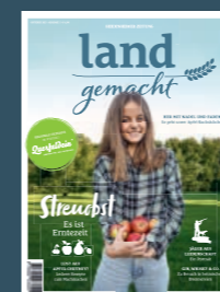
AUSGABE 3 2021